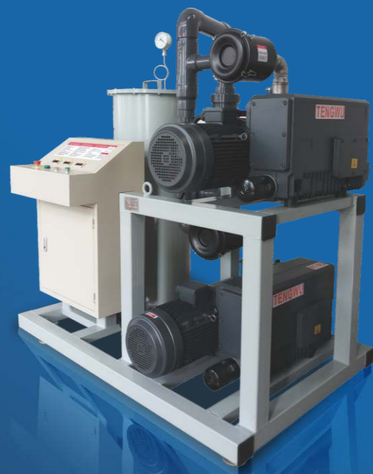
WJX600旋片式真空系统 WJX 600 rotary vacuum system

该真空泵真空度高，特别是在高真空阶段依然可以实现较大的抽气速率，实际使用功率低，噪音小，不需要额外的冷却系统，有较强的水蒸汽处理能力，无油烟排放，是一种新型的环保节能真空泵。（可选智能变频）