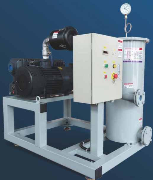
WJX300旋片式真空系统 WJX 300 rotary vacuum system